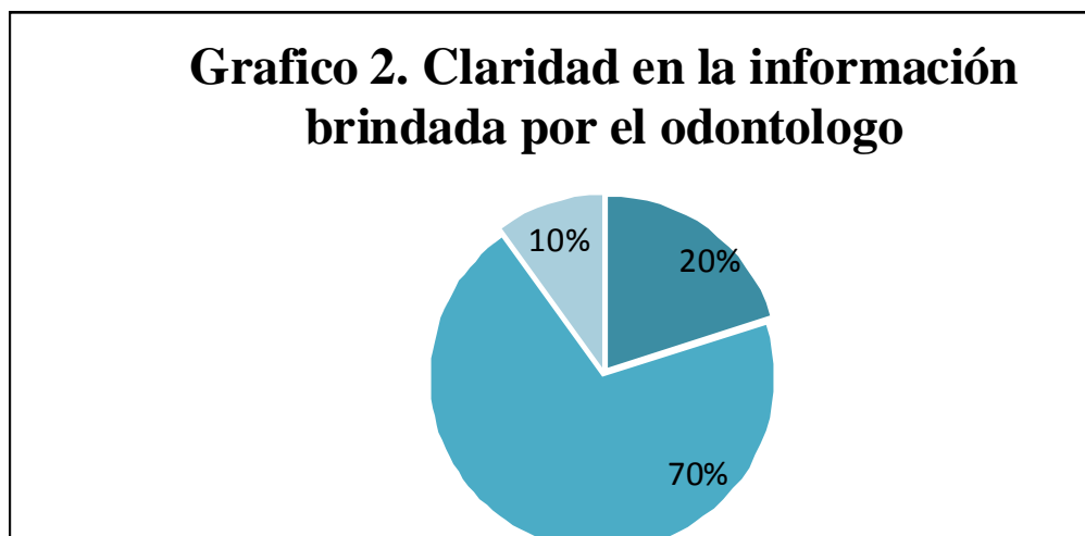
Gráfico 2. Claridad en la información brindada del odontólogo hacia el paciente.

El 85 % de la población expresa que es atendida en periodos rápidos de tiempo, con esto se refiere al tiempo en sillón dental, pero este resultado se ve contrarrestado con el tiempo que duraron en la recepción de los consultorios sentados en la sala de espera ya que el 60 % expresa que espera hasta 20 minutos (ver gráfico 1) .