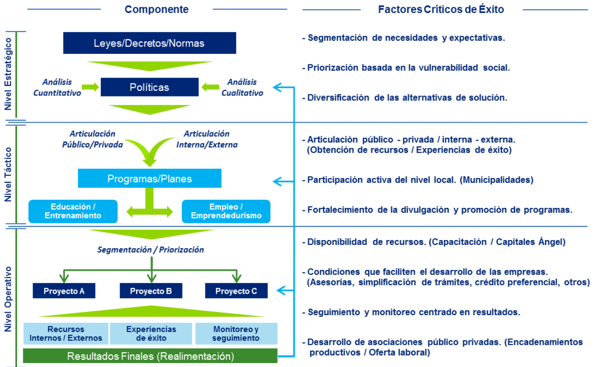
Modelo de Atención al Segmento NINI