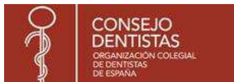
Fig. No 1. Logo del Consejo General de Colegios de Odontólogos y Estomatólogos de España (CGOCE).

La regulación de la comunidad odontología de España está regida por el Consejo General de Colegios de Odontólogos y Estomatólogos de España (ver Figura. No 1). Para poder ejercer la Estomatología de manera legal se debe estar inscrito en él. Este está ubicado en Madrid, constituido una área administrativa, por un comité ejecutivo de 12 miembros y el consejo interatómico que a su vez unidos conforma la Asamblea General. El Consejo cuenta también con una delegación responsable de los asuntos económicos, jurídicos y relaciones públicas. Además, existe la Fundación Dental Española (FDE) constituida por una junta de 9 miembros y .cuya meta es promover la salud oral en todos los sectores de la población además de la formación científica de los profesionales en odontología.