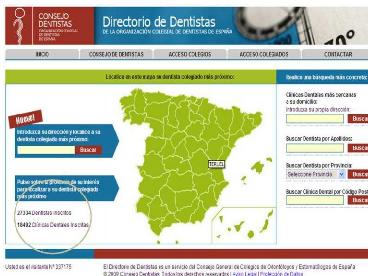
Fig. No 2. Cifra de odontólogos y clínicas inscritas en el CGOCE. Tomado de

El volumen de odontólogos ha aumentado considerablemente de 14 000 a 27 334 odontólogos inscritos, registrados hasta el 2009, (ver figura no. 2), tanto es así que la Organización Mundial de la Salud (OMS) considera ha duplicado esta cifra y que España podría abarcar sus necesidades de la salud buco dental con la mitad de esta cantidad de personal.