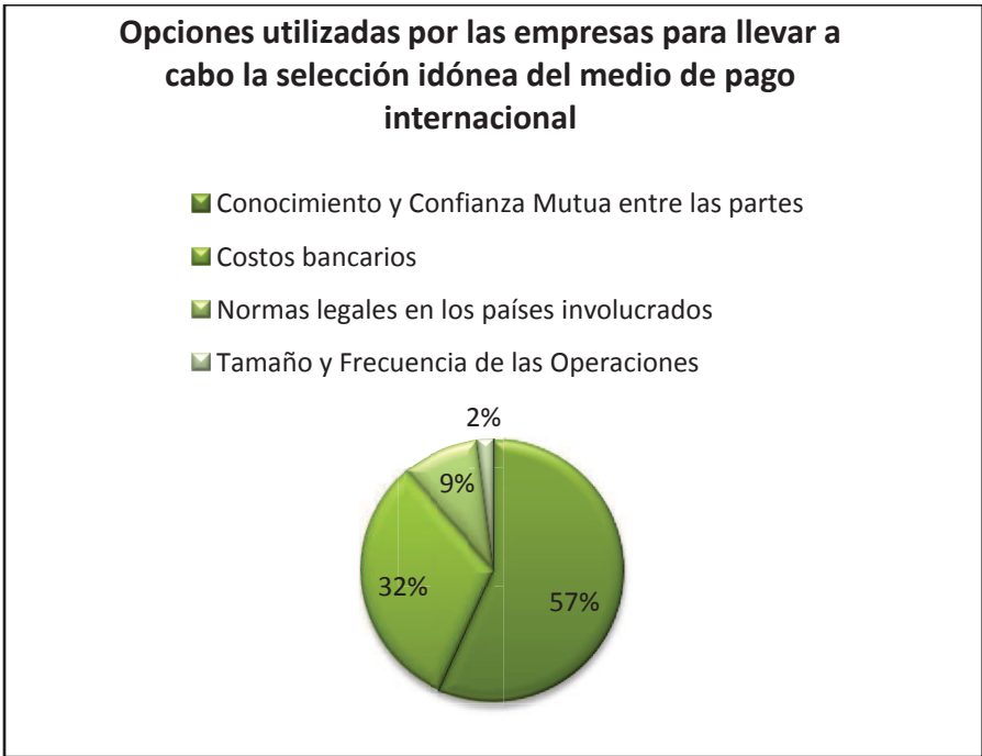
Grafico # 2: Forma de Selección del Medio de Pago realizado por las empresas del Sector.

Un dato importante en este punto es que sólo un 9% de las empresas encuestadas consideran y analizan la selección del medio de pago idóneo en relación a las normas legales de los países involucrados. Además, únicamente un 2% selecciona el medio de pago internacional por el tamaño y frecuencia de sus transacciones.