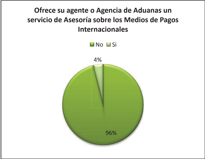
Grafico # 5: Ofrecen las Agencias Aduanales servicios de Asesoría en Medios de Pago Internacional.

Todo lo anterior indica, que el establecimiento de la Unidad de Asesoría Financiera en una agencia de aduanas, debe ser planteado de una manera correcta, con el fin de lograr llegar a las empresas exportadoras e importadoras de una forma adecuada y con las soluciones apropiadas en este tema financiero.