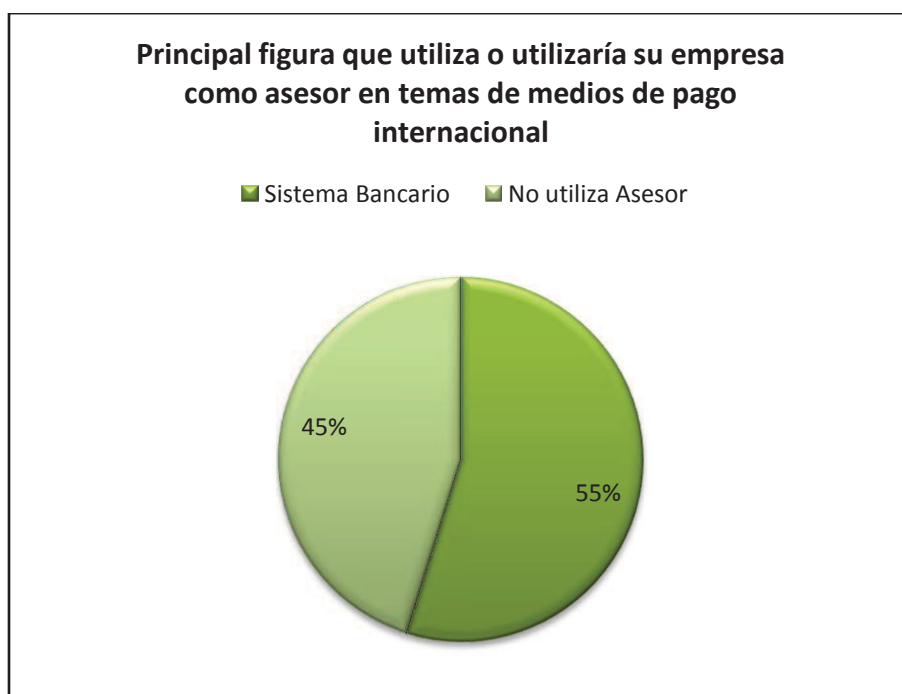
Grafico # 3: Principal Figura Asesora en Medios de Pago Internacional para las empresas importadoras y exportadoras.

Como parte fundamental de la creación de una unidad financiera asesora en medios de pago internacional, se hace necesario conocer quienes son la competencia directa de esta nueva unidad. Es así como el gráfico 3 muestra el resultado en relación a la figura asesora utilizada por las empresas costarricenses en el tema de medios de pago internacional.