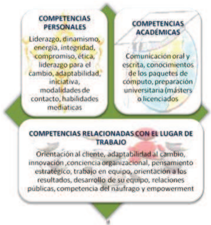
Diagrama #2. Competencias generales nivel ejecutivo

Con respecto a las competencias generales para los niveles ejecutivos el diagrama #2 muestra el perfil ideal de los profesionales en transporte internacional de cargas.