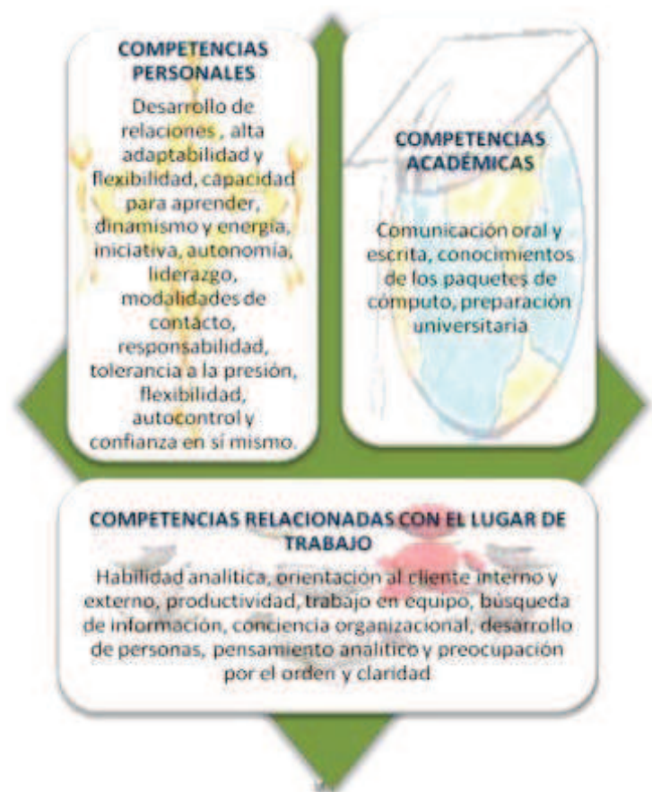
Diagrama #6. Competencias generales nivel inicial

Con respecto al perfil de los profesionales de niveles iniciales el diagrama #6 y el diagrama #7 muestran las principales competencias generales y disciplinarias respectivamente.